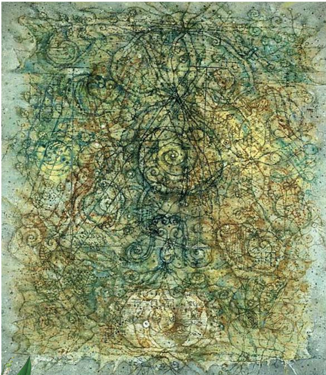
Здењек Скленарж, Калиграфија, 1975